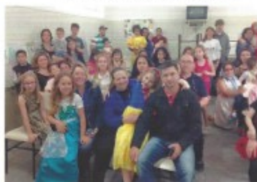
Dia da família na escola (pág. 17)