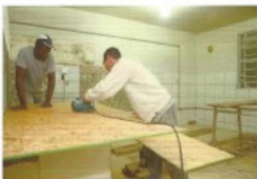
Reforma da cozinha (pág. 23)