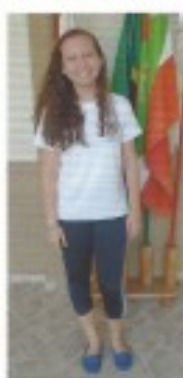
1º LUGAR (9º02)