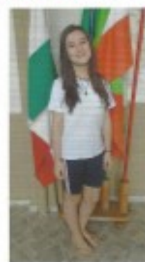
3º LUGAR (8º03)