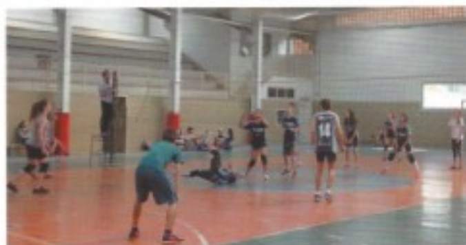
Torneio de voleibol