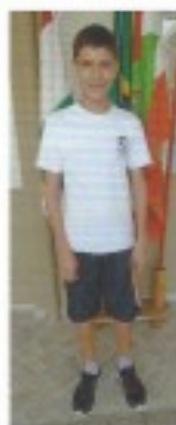
2º LUGAR (8º01)