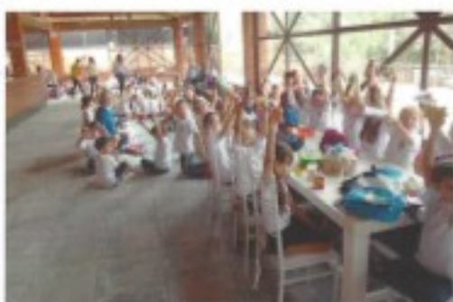
Semana da Criança (pág. 22)