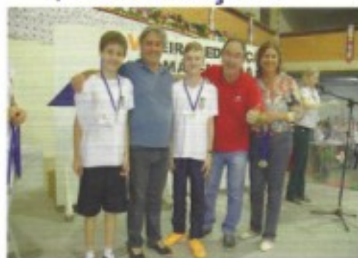
Feira da Matemática (pág. 16)