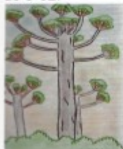
Mata dos Pinhais, Araucária ou Pinheiro do Paraná (Alice T. Ribeiro)

Observem a beleza das paisagens naturais do Brasil na visão de algumas alunas do 8º02.