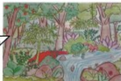
Floresta Equatorial (Camila P. Cheuchuk)