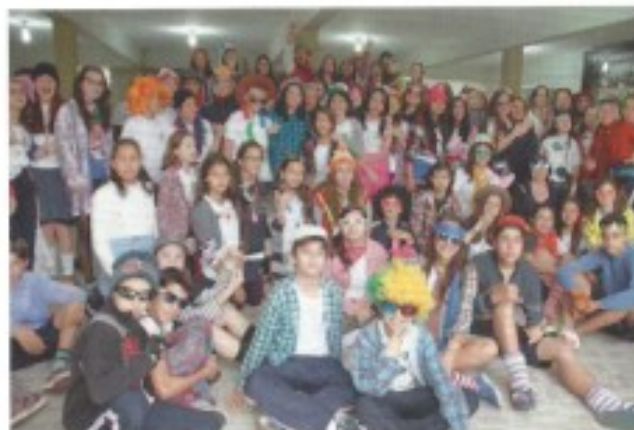
Dia do Brega