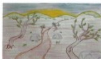
Vegetação Cerrado (Alice T. Ribeiro)