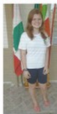
3º LUGAR (9º02)