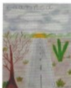
Formação vegetal do clima semiárido (Beatriz F. Depin)