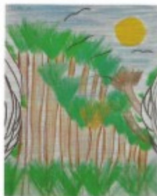
Floresta Tropical (Gabriela R. Vegini)